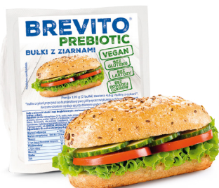
BULKI Z ZIARNAMI masa netto: 120 g