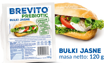
BULKI JASNE masa netto: 120 g