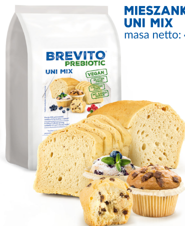
MIESZANKA UNI MIX masa netto: 400 g