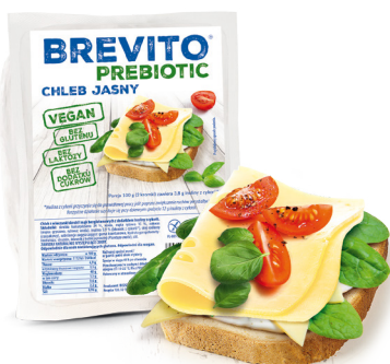
CHLEB JASNY masa netto: 200 g