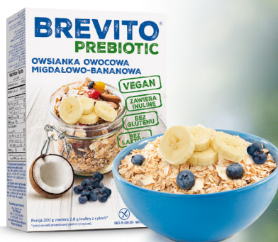
OWSIANKA OWOCOWA MIGDAŁOWO-BANANOWA masa netto: 150 g

Składnik żywności pobudzający rozwój korzystnej mikroflory jelit, co wpływa na poprawę zdrowia poprzez: wzrost ilości bakterii z rodzaju Bifidobacterium (korzystnych mikroorganizmów jelitowych) regulację ruchów perystaltycznych jelit zmniejszanie produkcji szkodliwych związków i toksyn jelitowych